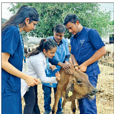
शिविर में पशुओं का टीकाकरण करते हुए विद्यार्थी।

संस्कारम वेटेनरी कॉलेज द्वारा फारूखनगर की श्रीगोशाला में एक दिवसीय पशु चिकित्सा एवं टीकाकरण शिविर का आयोजन किया गया। शिविर में विद्यार्थियों ने दर्जनों गायों और बछड़ों की स्वास्थ्य जांच करते हुए बीमार पशुओं का टीकाकरण भी किया। विद्यार्थियों को पढ़ाई के साथ-साथ व्यवहारिक प्रशिक्षण देने के उद्देश्य से आयोजित इस शिविर में विद्यार्थियों ने ग्रामीणों से बातचीत कर पशुओं की देखभाल, सही आहार, साफ-सफाई और टीकाकरण के समय