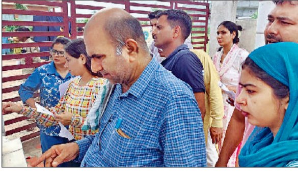
झज्जर। परीक्षा केंद्र के बाहर सितिंग प्लान देखते हुए अभ्यर्थी व परीक्षा केंद्र के बाहर कतारबद्ध खड़े अभ्यर्थी व परीक्षा केंद्र के बाहर अभिभावक अपनी बेटी की कान की बाली उतारते हुए।