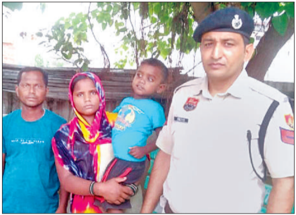
बहादुरगढ़। बच्चे को अभिभावकों को सौंपती पुलिस।