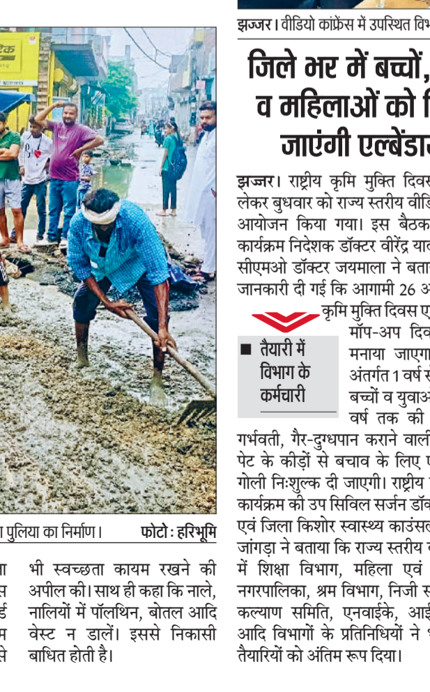
बहादुरगढ़। वार्ड एक में किया जा रहा पुलिया का निर्माण।