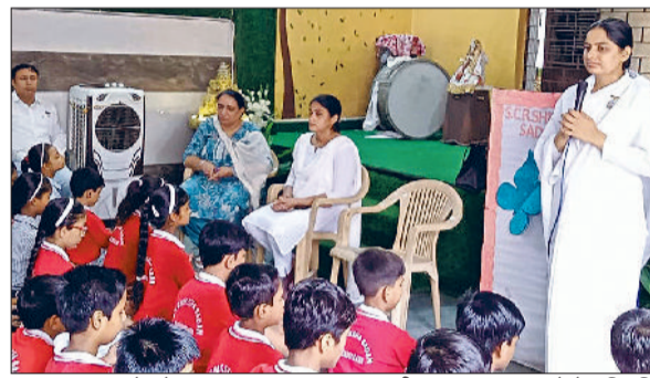
हरिभूमि न्यूज़ | बहादुरगढ़

बहादुरगढ़। बच्चों को रक्षा बंधन का महत्व समझाती वक्ता।