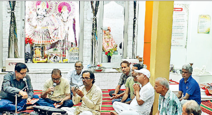
झज्जर। बाबा कांशी गिरी मंदिर में भजनों का आनंद लेते हुए श्रद्धालु।