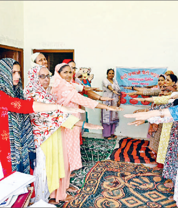
झज्जर। भूषण हत्या रोकने संबंधी शपथ लेते हुए आंगनवाड़ी वर्कर्स।