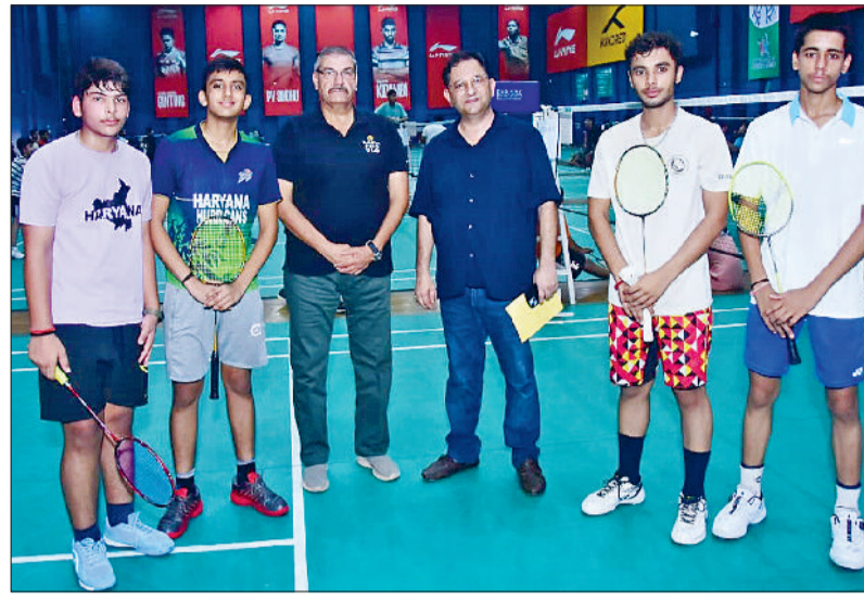
बहादुरगढ़। अतिथियों के साथ विजेता खिलाड़ी।